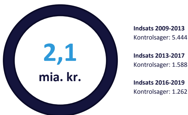
Figur 1. Samlet skatteregning for kontrolsager

Skatteregning for Indsats 2016-2019 Den seneste Money Transfer-indsats har medført skatteregninger for ca. 400 mio. kr.