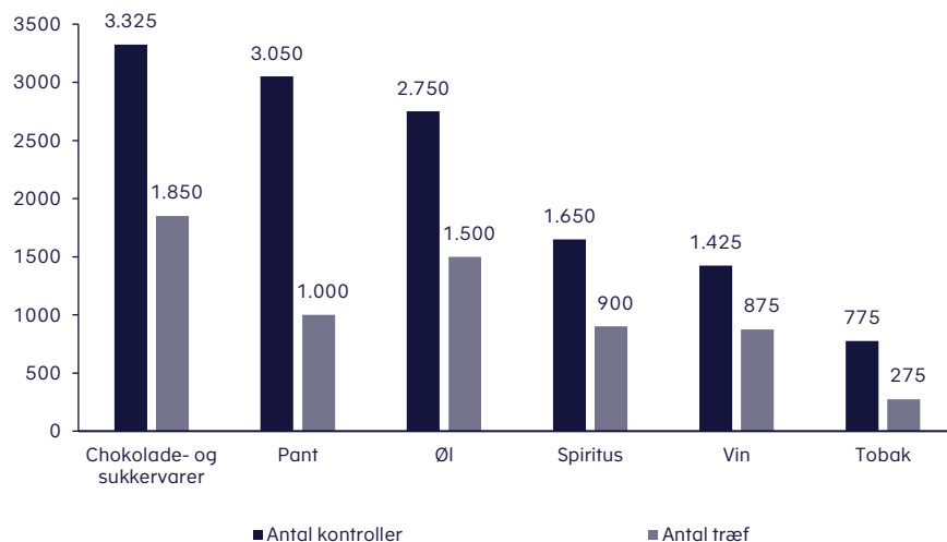
Figur 2. Kontroller fordelt på type af punktafgiftspligtige varer

Eksempelvis resulterede 3.330 kontroller i 1.850 træf i forhold til chokolade- og sukkervarer, mens 2.750 kontroller resulterede i 1.500 træf i forhold til øl, jf. figur 3 . Regelovertredelserne spænder fra simple fejl til bevidst skatteunddragelse.