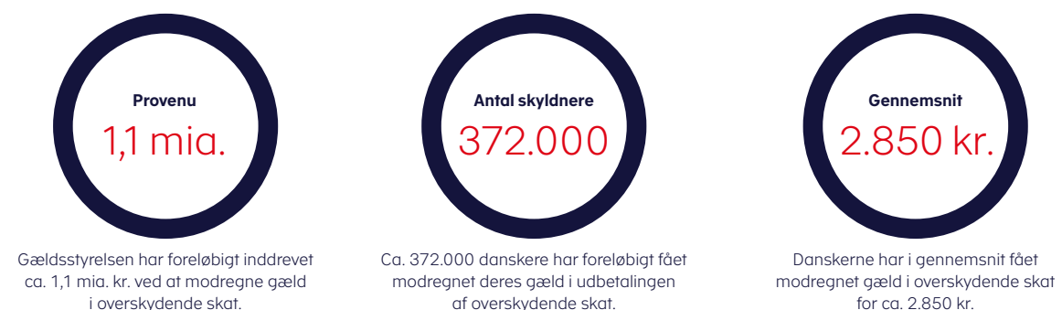
Figur 1. Nøgletal for modregning i overskydende skat fra 2018

Gældsstyrelsen har foreløbigt inddrevet ca. 1,1 mia. kr. ved at modregne omkring 372.000 danskeres gæld i udbetalingen af overskydende skat fra 2018. I gennemsnit har danskerne fået modregnet gæld for ca. 2.850 kr. i deres overskydende skat, jf. figur 1 . Provenuet forventes at stige til ca. 3 mia. kr. i takt med, at Gældsstyrelsen gennemgår al den tilbageholdte overskydende skat frem mod september 2019.