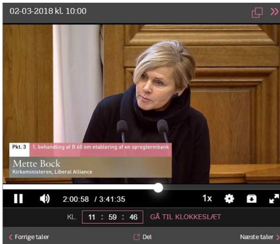
Kulturminister Mette Bock [LA].