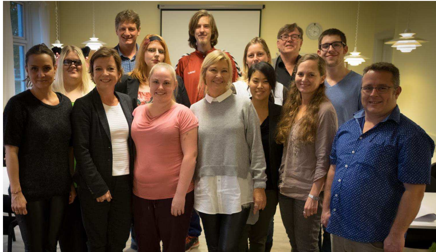
Billederne er fra ministerbesøg fra daværende social- og indenrigsminister Karen Ellemann, 2016