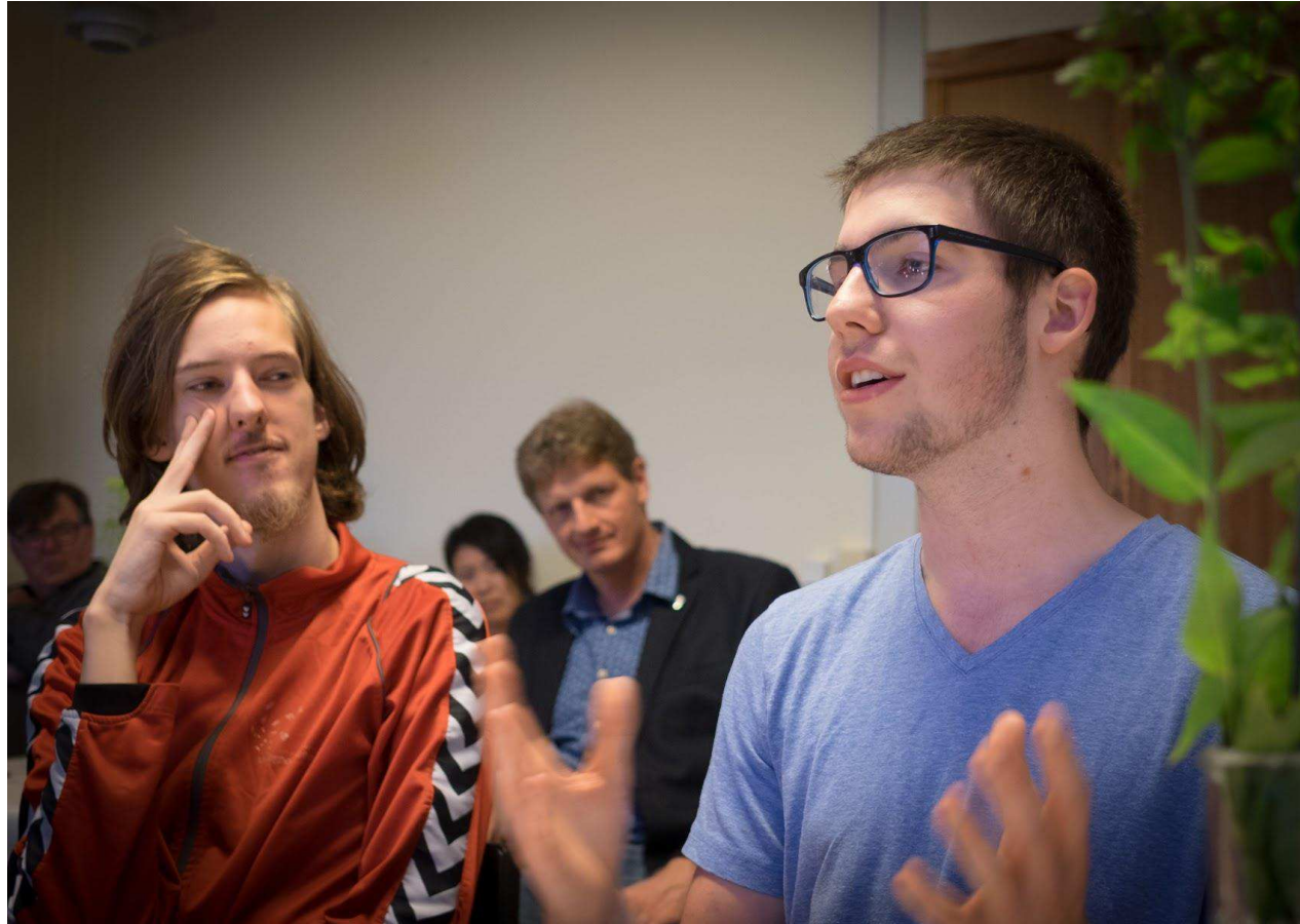
Foretræde for Beskæftigelsesudvalget den 8. november 2017