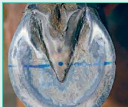
Figur 6. Linjen fra figur 5 er her fortsat på sålefladen. Linjen går igennem centrum for rotation, lokaliseret ca. 2,5 cm bag stråle-spidsen på en renskåret strålespids. Set fra sålefladen bør denne linje ligeledes på en hov i optimal balance dele bærefladen i to lige store dele.

(fortil-bagtil) balance. Delelementerne er lette at forholde sig til og derfor meget anvendelige, når en hov bedømmes.