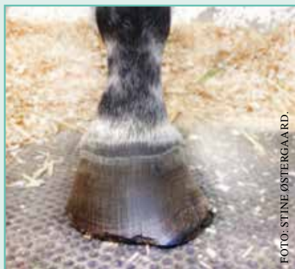
Figur 4: Venstre forhov med udvendig vingedannelse.