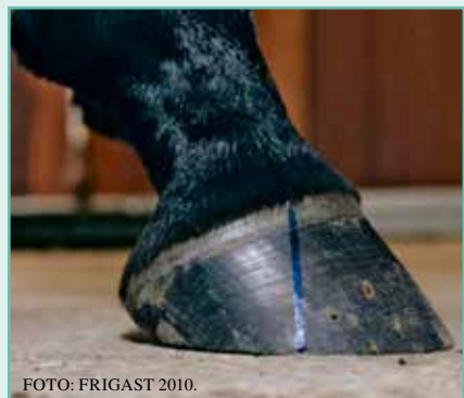
Figur 5. Centrum for rotation kan findes ved at betragte hoven fra siden. Kronrandens længde inddeles i fire lige store stykker. Centrum for rotation er lokaliseret i kronranden: \frac{1}{4} af distancen fra mest dorsale mod mest palmar aspekt. Fra dette punkt trækkes en lodret linje til jorden. Denne linje deler på en hov i optimal balance bærefladen i to lige store stykker.