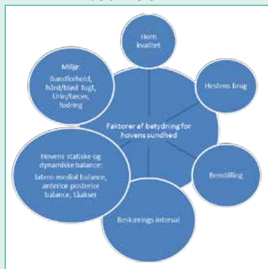
Figur 2. Faktorer af betydning for god beskæring. Cirkelens størrelse afspejler vigtigheden.

Udformningen af den optimale hov er blevet beskrevet via en række definerede kriterier. Den består af sundt, stærkt horn. Vinklen mellem tåvæg og underlag er ca. 45-52° på et forben og 52-55° på et bagben [12] . Horntrådene skal være parallelle med tåvæggen. Vinklen mellem dragtvæg og underlag skal tilsvare tåvæggenes vinkel [12,13] . Vækstringene skal være orienteret parallelt med kronranden og med underlaget, når hoven ses forfra. Den mediale hovvæg er lidt stejlere end den laterale som udtryk for, at lidt mere vægt bæres indvendigt end udvendigt [13] . Hovvæggen skal desuden have et lige forløb fra kronrand til underlag uden vingedannelse [12-14] . Selvom disse beskrivelser er korrekte og ønskværdige, er det vigtigt at understrege, at »den optimale hovform« sjældent forekommer. Hver hov er forskellig, og til hvert ben hører en ideel hovform, der søges gennem den bedst mulige beskæring. Faktorerne, som skal bedømmes, er altid de samme, og opnåelse af statisk og dynamisk balance er kernen i korrekt beskæring og beslag [12] . Den statiske balance bedømmes på den stående hest. Hovens dynamiske balance vurderes, når hesten er i bevægelse, i skridt eller trav. Som figur 2 illustrerer, består processen omkring opnåelse af balance af forskellige delelementer: Opnåelse af medio-lateral (udvendig-indvendig) balance og posterior-anterior