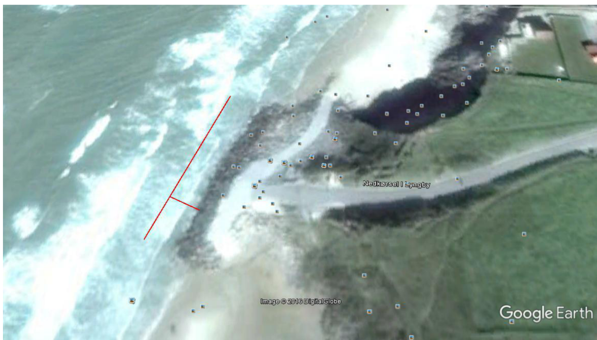
Google map 9 august 2015