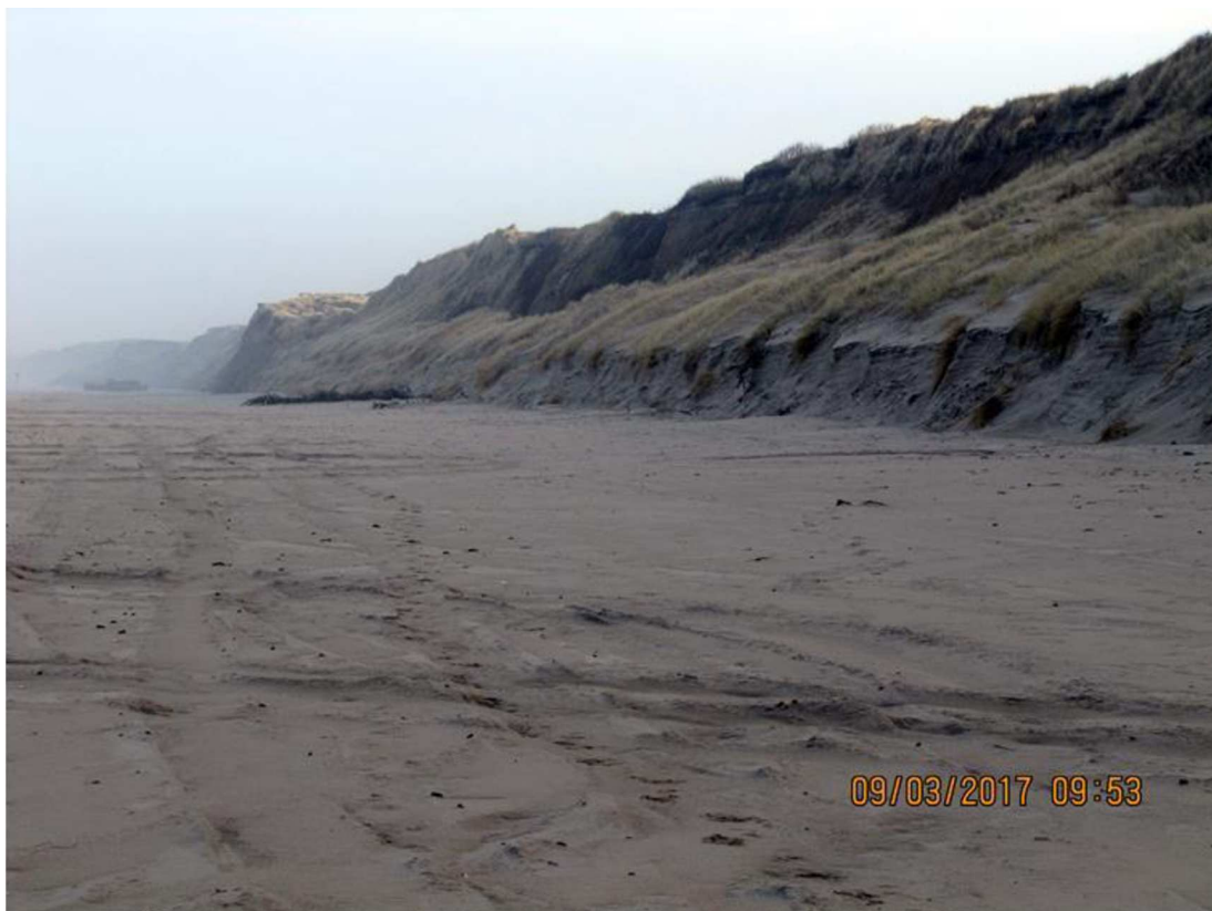
Ved Løkken strand Camping tog Urd ca. 7,5 kubikmeter pr meter af de nye klitter