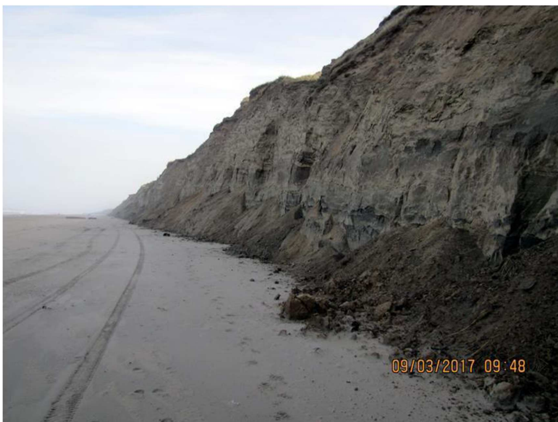
Skrænten ved Løkken Strand Camping stod fuldstændig lodret i 2000, som vi ser her syd for Nr. Lyngby, hvor vi endnu ikke har etableret SIC systemet