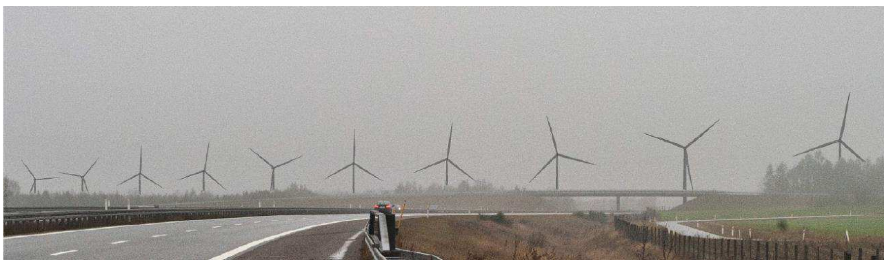
Figur 2: Billedvisualisering af 10 vindmøller langs Midtjyske Motorvej

For at forhindre denne obstruktions-mulighed for en klager, er der behov for en hurtig beslutning om en overgangsordning.