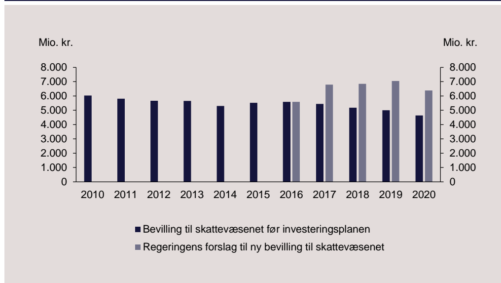
Figur 3. Regeringens forslag til ny bevilling til skatteforvaltningen

Investeringerne vil betyde, at skatteforvaltningens samlede rammer øges med 1,3 mia. kr. i 2017, 1,7 mia. kr. i 2018, 2,1 mia. kr. i 2019 og 1,8 mia. kr. i 2020, jf. figur 3 . Dertil kommer væsentlige investeringer i it-systemer finansieret af den statslige låneramme.