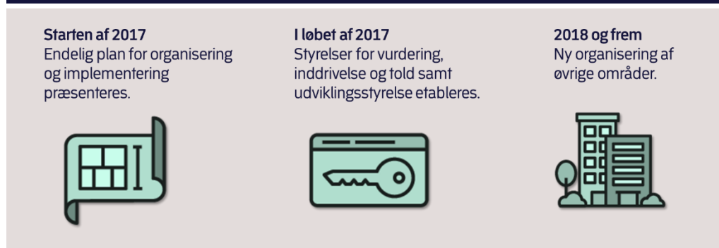
Figur 2. Tidsplan for implementering af det nye skattevæsen

Borgere og virksomheder skal således fremadrettet fortsat have én samlet indgang til skatteforvaltningen, selv om flere forretningsområder drives som selvstændige styrelser. Den samlede implementeringsplan for det nye skattevæsen forventes fremlagt i starten af 2017.