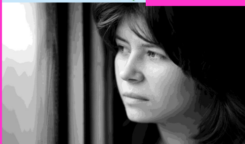
Trivsel som cæncerramte