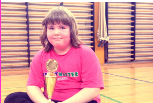
Landsdækkende frivillig forening