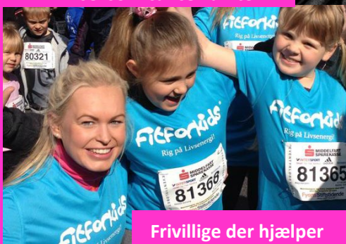
Frivillige der hjælper