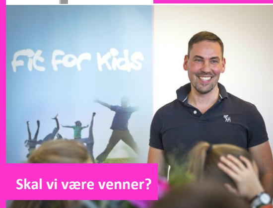
Skal vi være venner?