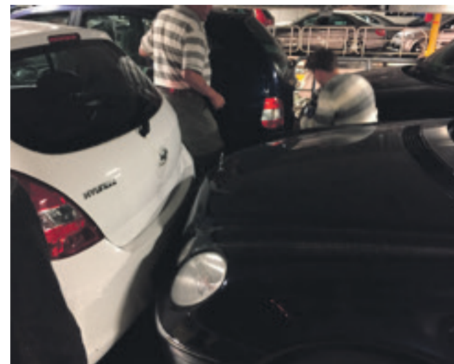
Mange biler var stødt ind i hinanden på dækket under den voldsomme overfart, der ikke nåede frem til Ystad.

Efterlyste information til passagererne i terminalen fra rederiet: