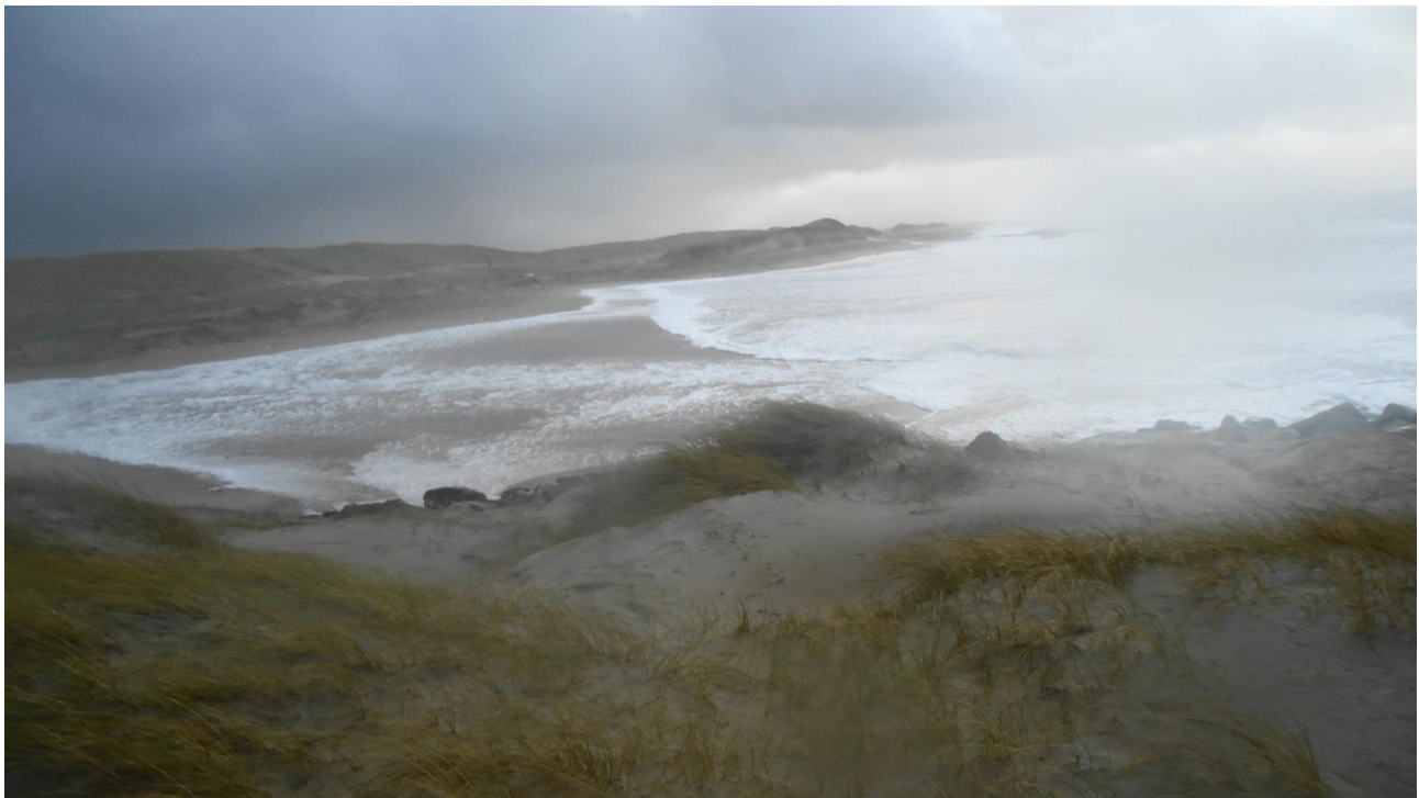
Billed 4. (dagen før stormen Egon)

Her ser i virkelig, hvor langt havet er oppe i digerne og på vej bag om depotet. På den anden side af dige toppen er Engene og der er ikke langt op.