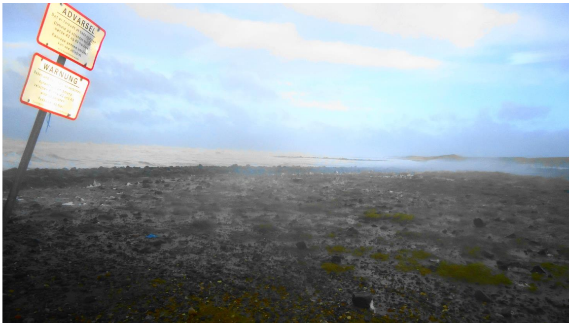
Billed 1. (Stormen Bodil)

Et billed fra 2013, 24 timer efter stormen Bodil.