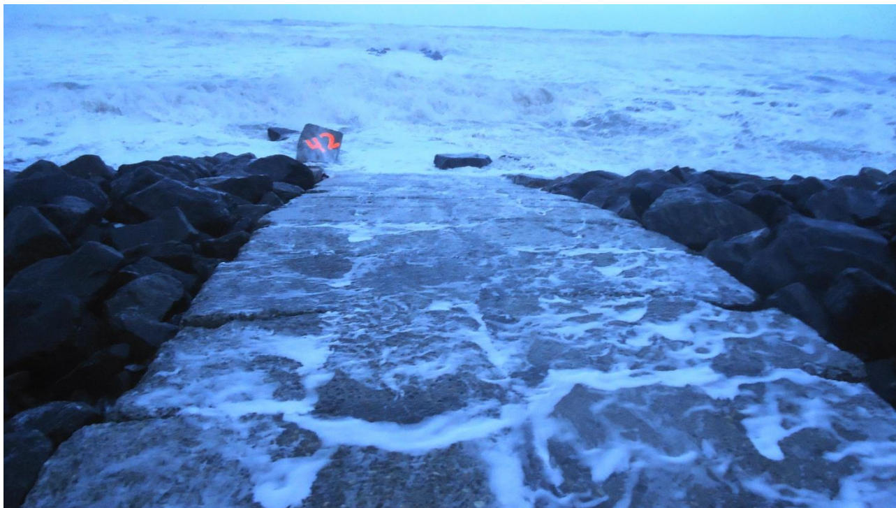
Billed 5. (Stormen Egon)

Billedet er taget stående på øst ende af hølde 42, som ligger ude under havet.