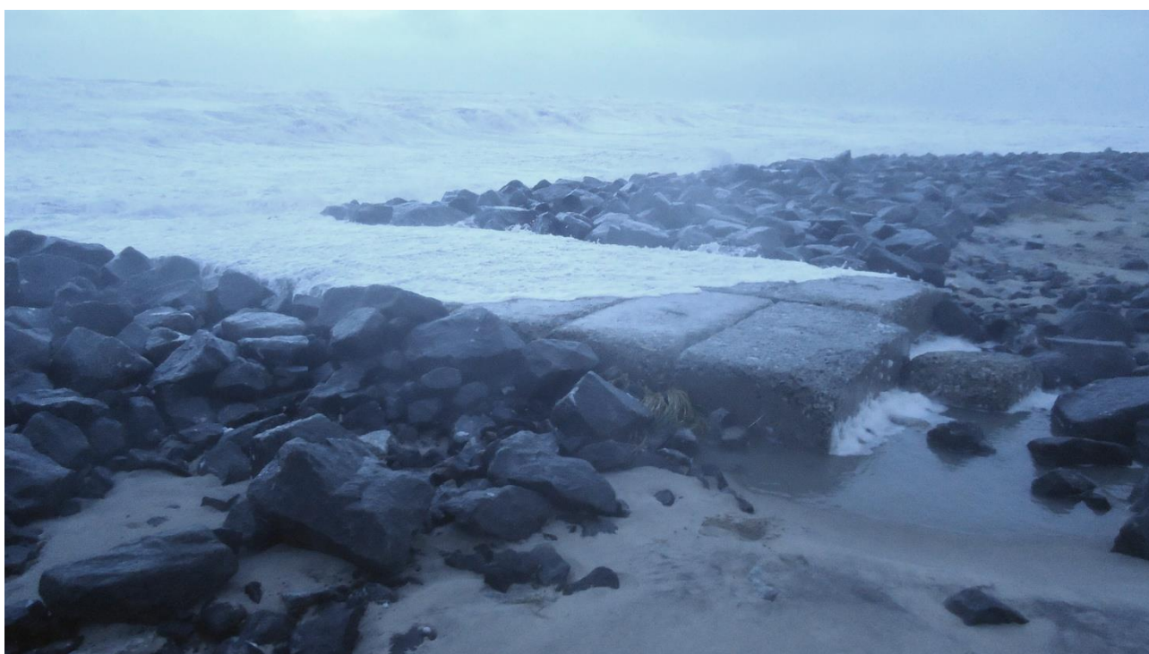
Billed 6. ( Stormen Egon)

Billedet er taget stående på øst ende af hølde 42, som ligger ude under havet.