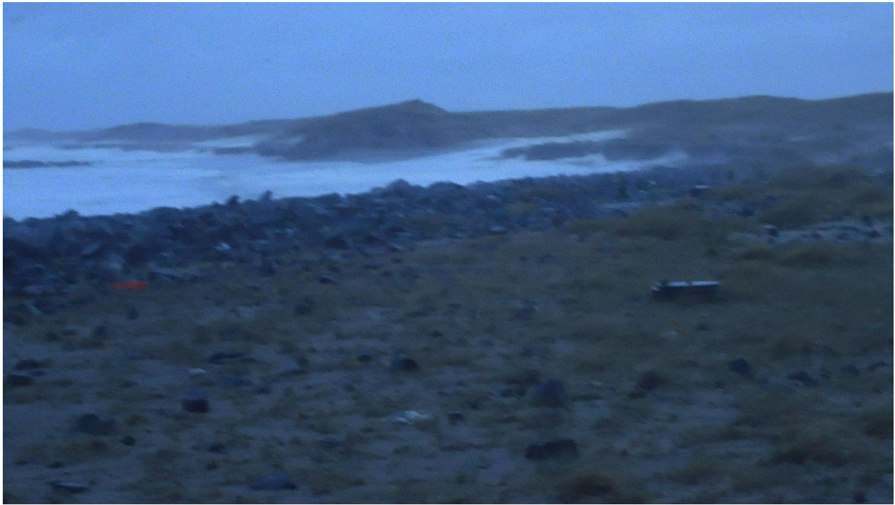
Billed 3. (Stormen Egon)

Her ser i virkelig, hvor langt havet er oppe i digerne og på vej bag om depotet. På den anden side af dige toppen er Engene og der er ikke langt op.