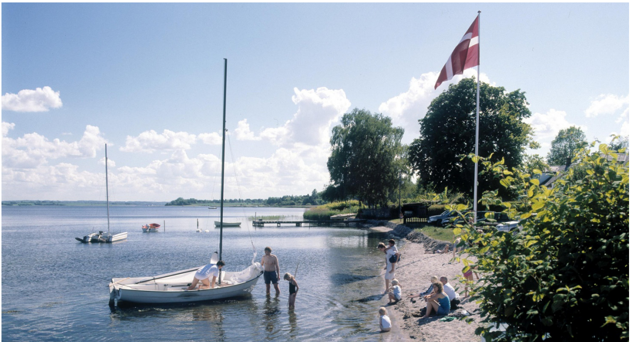
Friluftsliv med familien en sommerdag ved Gershøj.

Landbrugsproduktionen vil i sagens natur medføre såvel støj som lugt med videre. Det må naturelskeren tage som en oplevelse, der er med til at sætte naturen i perspektiv.