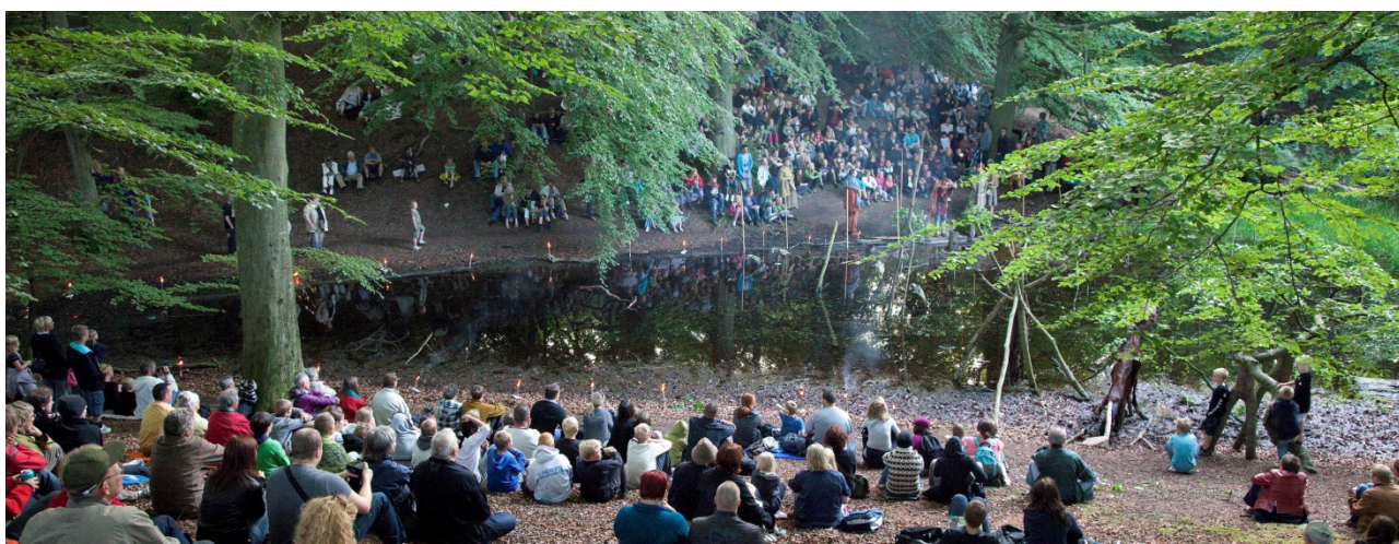
Formidling ude i landskabet kan give store oplevelser. Her i Sagnlandet Lejre.

Roskilde Universitet: Miljø, samfund og rumlig planlægning, miljøbiologi, geografi, natur og modeller, historie, kulturhistorie og identitet, oplevelsesøkonomi og turisme, information og kommunikation samt projektudvikling. Danmarks Miljøundersøgelser: Miljø- og naturforvaltning, klimaeffekter på land og vand, klimaøkonomi, jordbrug natur og miljø samt marin økologi. Roskilde Museum: Arkæologi, forskning, samling, dokumentation og formidling af kulturspor fra tidligste tider til nu. Vikingskibsmuseet: Marin arkæologi, forskning, samling, dokumentation og formidling af sejlskibe, med hovedvægten på vikingetid. Rekonstruktion og test af vikingskibe m.fl. DTU Risø: Teknologisk innovation og udvikling, klima og energisystemer, vindenergi, bioenergi, solenergi, biomaterialer samt dyrkningsmetoder. Sagnlandet Lejre: Forskningsbaseret afprøvning og rekonstruktion af landskabsmiljøer gennem tiderne. Madkulturen: Fødevarer og madkultur, principperne i Ny Nordisk Mad udbredes til uddannelser og samfund. Samarbejder med Slagteriskolen. Lyngby Landbrugsskole: Uddannelser indenfor landbrug. Erhvervs Akademi Sjælland: Blandt andet Have og Park, Markedsføring og Webudvikling.