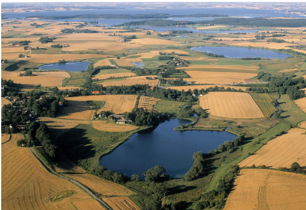
Kornerup Sø. I det fjerne anes kysten mod Frederikssund.

Sådanne bemærkninger skal så behandles af ministeren, der først derefter vil kunne oprette nationalparken gennem udstedelse af en bekendtgørelse herom, i givet fald muligt senere i 2014.