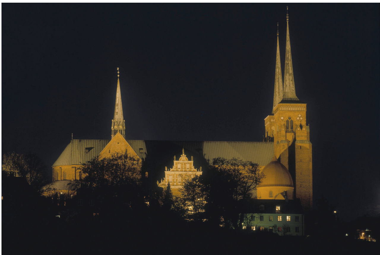
Roskilde Domkirke er verdensarv. En arkitektonisk enestående katedral i fortsat udvikling i tidens ånd. Intet andet sted i verden hviler så mange kongelige som her.