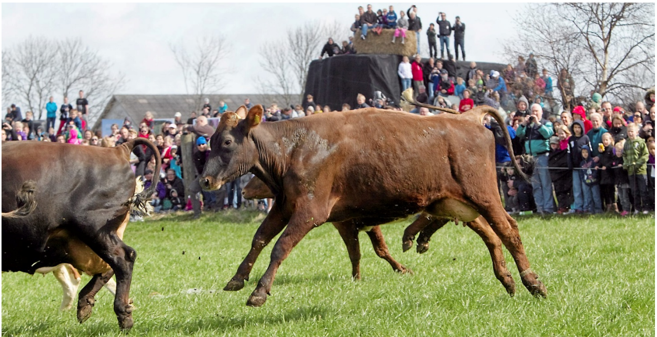
På én økodag kommer der 10.000 besøgende og ser køerne blive sluppet ud på græs. Til sammenligning tiltrækker områdets største attraktion Vikingskibsmuseet 120.000 gæster om året.