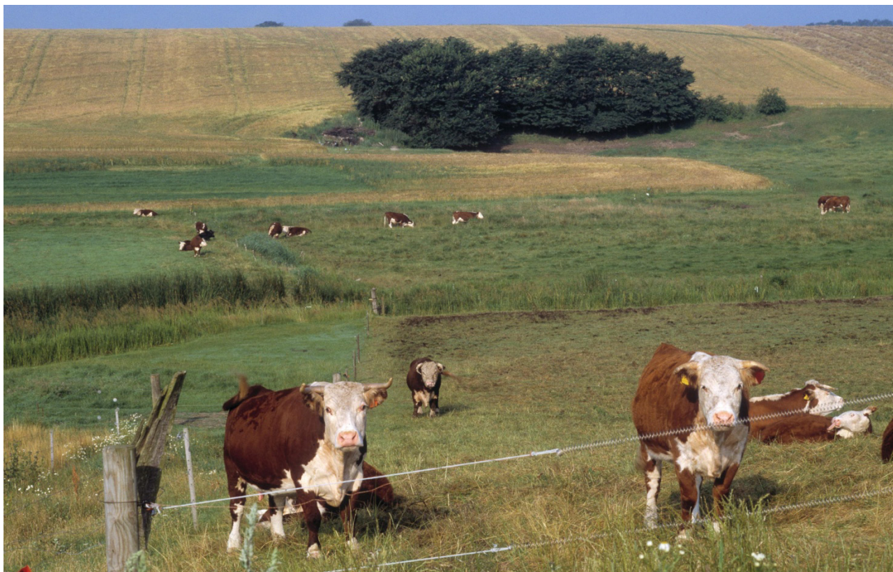
Ved Gevninge. "Køer og heste og får på græs, hen over brede agre, åbne lader for fulde læs, sejl som stryger om klint og næs, byger som går og kommer, det er den danske sommer". Thøger Larsen 1914.

Der har været drevet jagt i dette landskab gennem 12.000 år. Vildtbestandene er vokset markant over de sidste årtier og det synes nødvendigt at regulere en del bestande. Målet er at opretholde sunde vildtbestande i landskabet.