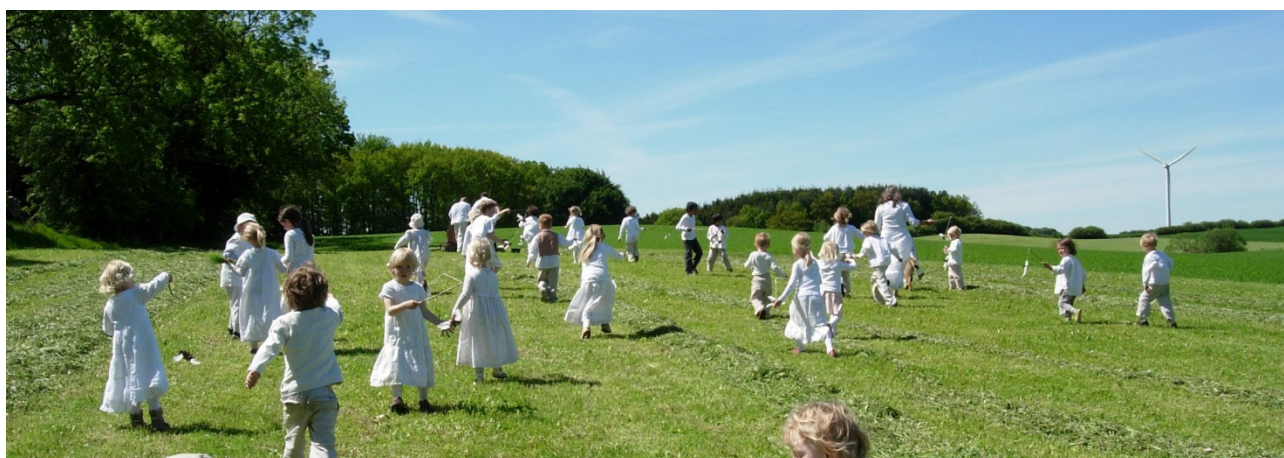
En nationalpark er tænkt i et langsigtet perspektiv til glæde for kommende generationer. Lindholm Skovbørnehave.

Dog tillægges processen på styregruppemødet i oktober yderligere 2 måneder, idet lodsejerforeningen melder ud, at den har konstateret en manglende opbakning blandt lodsejerne. De to måneder skal blandt andet bruges på en lodsejerworkshop i november med henblik på en yderligere afdækning af, hvad der skal til, for at lodsejerne kan blive mere trygge ved parken, og der er ønske om at lodde stemningen yderligere.