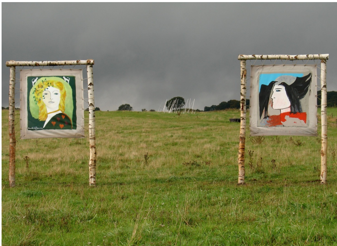
Kunst i landskabet ved Gl. Lejre: Freja, Odin og blankt stål giver nyt perspektiv på landskabet. Skjoldungelandet 2009.

RUC og andre forskningsinstitutioner opfordres til at indtræde i nationalparkrådet, og her etablere et forsknings- og udviklingsorienteret delnetværk.