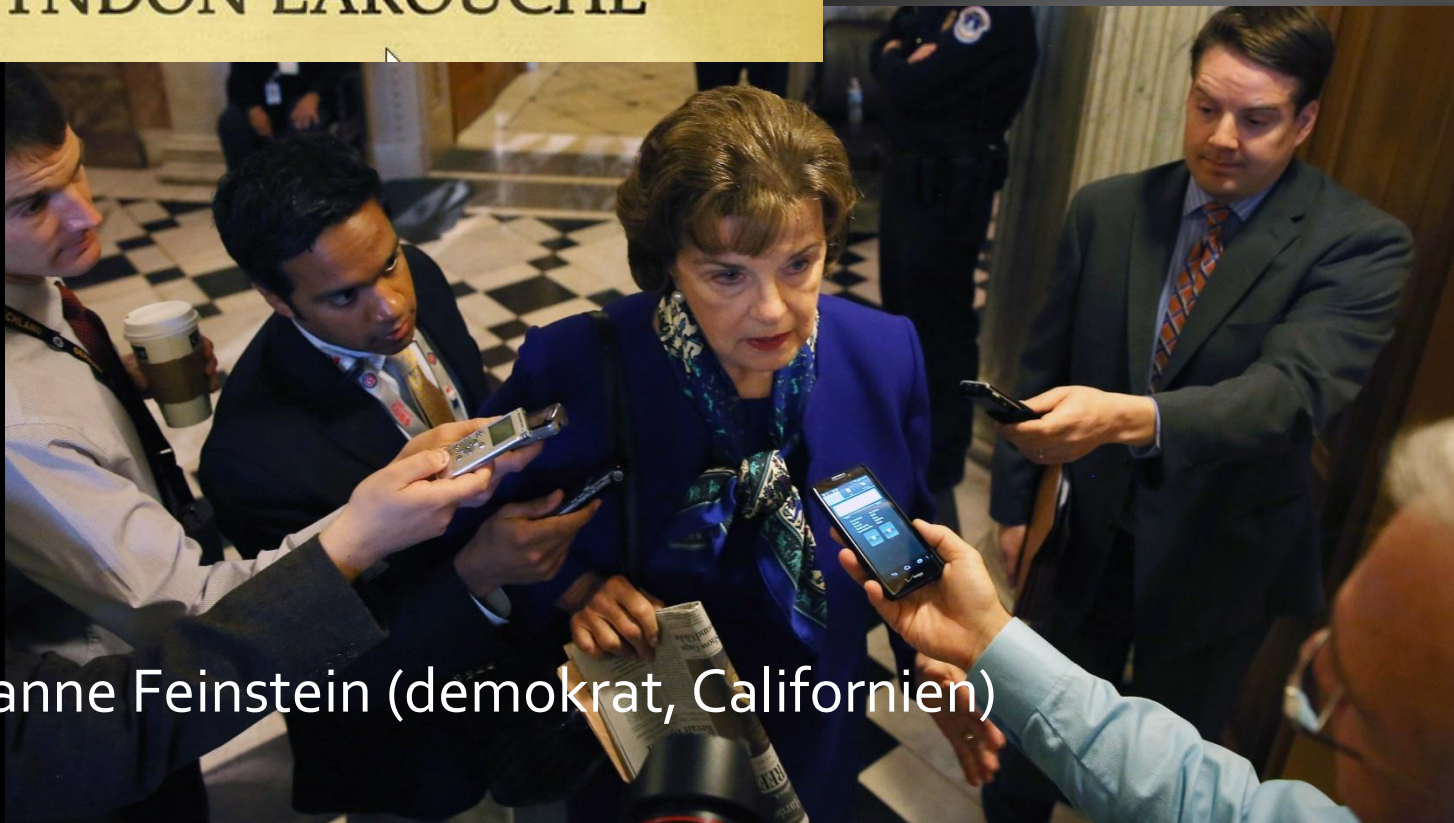
Senator Dianne Feinstein (demokrat, Californien)