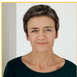
Margrethe Vestager Økonomi- og indenrigsminister