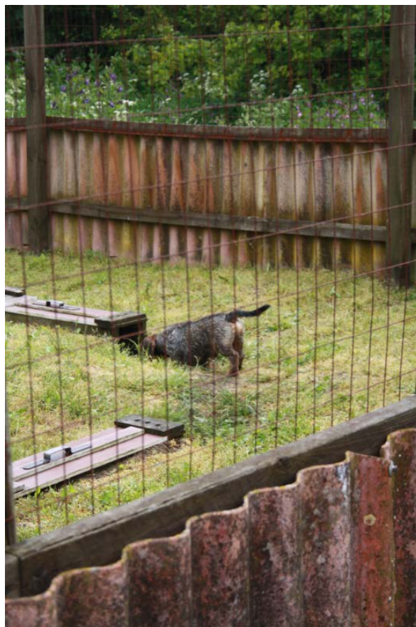
Gravhund på vej i grav

Det må derfor være i alles interesse, både jægere og det øvrige samfund, at der til stadighed er en god og sund, men ikke for tæt rævebestand i Danmark, da det vil give en uforholdsmæssig stor prædation til skade for den øvrige fauna, og samtidig øger en tæt bestand smitterisikoen for diverse sygdomme betragteligt. For at nå dette ideal, skal der til stadighed være et veltrænnet korps af gravsøgende hunde som både kan bruges til gravjagt og stå til rådighed for reguleringsopgaverne, i den udstrækning det øvrige samfund har behov for hjælp.