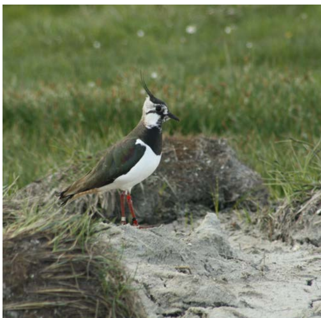
Jordrugende fugle som viben er også et af rævens foretrukne byttedyr

De jordrugende fugle i agerlandet, påvirkes også af et ikke ubetydeligt pres, og da vi ved at agerlandets fugle som viben, lærke og agerhøne er i væsentlig tilbagegang, er det også her nødvendigt at forvalte ræven.