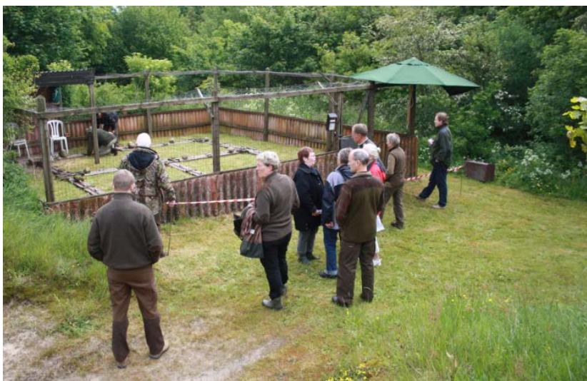
Oplæring og afprøvningsanlæg

Det foreslås, at der i lighed med zoologiske haver, dyreparker samt ræve til tekniske og videnskabelige undersøgelser, indføres den samme undtagelse for ræve til oplæring og afprøvning af gravsøgende hunde, og at der indledes et lovgivningsarbejde for at få lavet en bekendtgørelse, der i detaljer afstikker reglerne for hold af ræve samt brug af disse til oplæring af gravsøgende hunde, således at alt er på plads i god tid inden 2017, hvor ræveholdene skal være afviklet. Som en del af historien skal det nævnes, at der foreligger væsentlig dokumentation for hvordan rævehold, samt, oplæring og afprøvning af gravsøgende hunde foregår. Denne dokumentation er udviklet i slutning af 1980'erne og løbende udbygget. Her har der løbende været demonstration af hvordan rævehold og oplæring foregår, hvor justitsminister Frank Jensen fik demonstreret dette i 1998 med fuld accept af de anvendte fremgangsmåder. I 2008 blev der ligeledes foretaget en demonstration for fødevarerudvalget, som førte til den nuværende lovtekst.