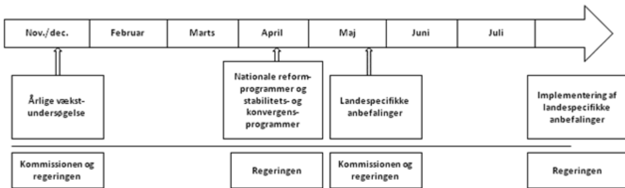
Figur 2: Det »nationale semester«

Derudover kan de to udvalg invitere de økonomiske vismænd og/eller repræsentanter fra Nationalbanken m.fl. til at redegøre for deres økonomiske vurderinger.