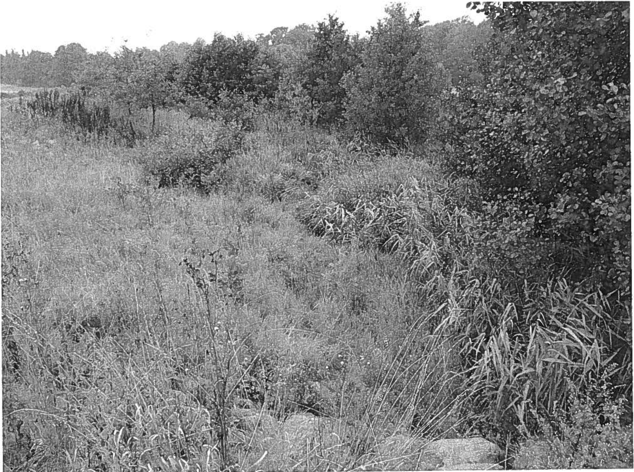
Afvandingsgrøft restaureret til miniådal