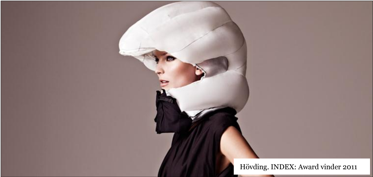
Hövding. INDEX: Award vinder 2011