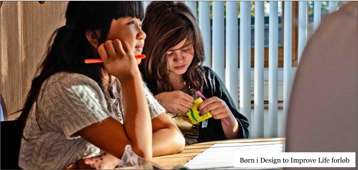
Børn i Design to Improve Life forløb