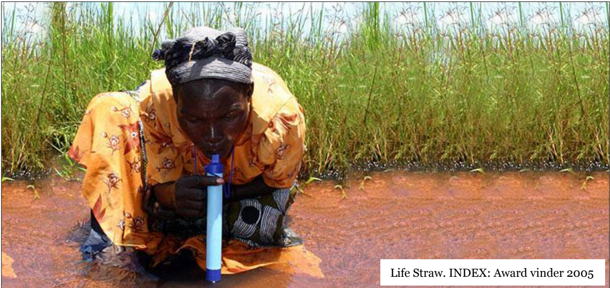
Life Straw. INDEX: Award vinder 2005