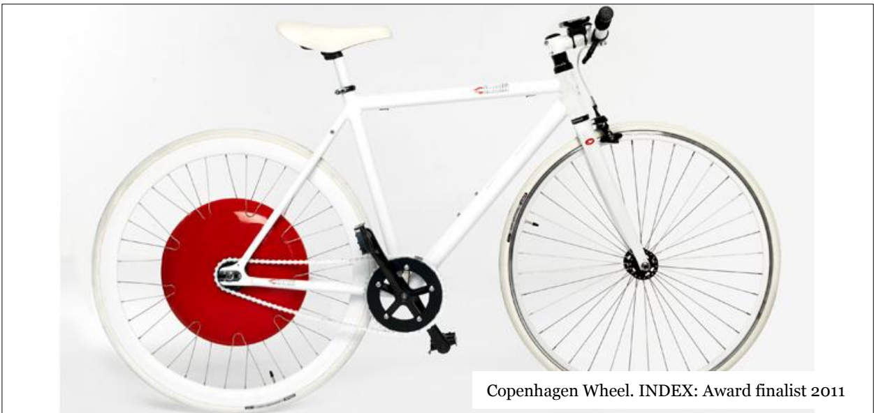
Copenhagen Wheel. INDEX: Award finalist 2011