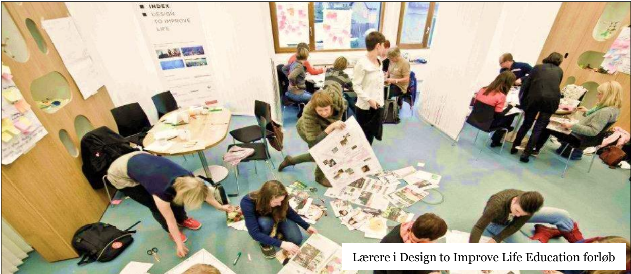
Lærere i Design to Improve Life Education forløb