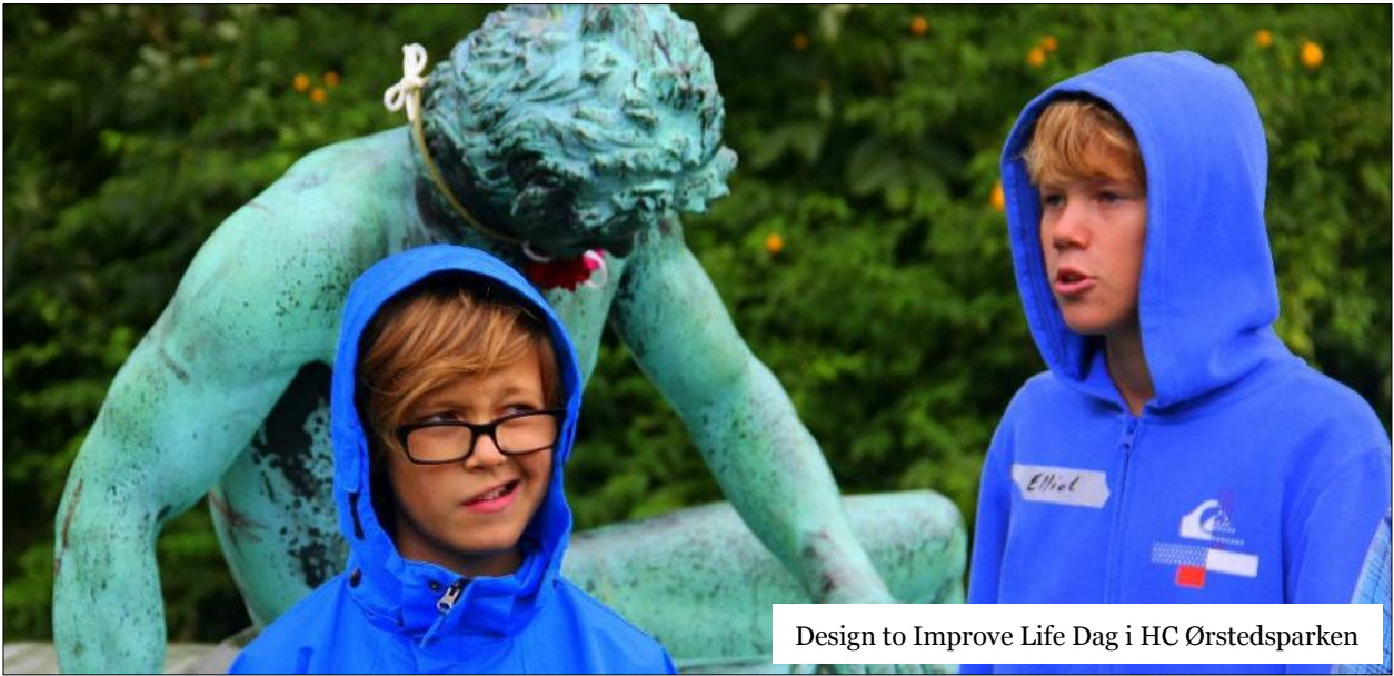
Design to Improve Life Dag i HC Ørstedsparken