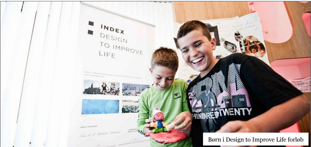
Børn i Design to Improve Life forløb