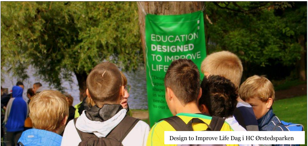
Design to Improve Life Dag i HC Ørstedsparken