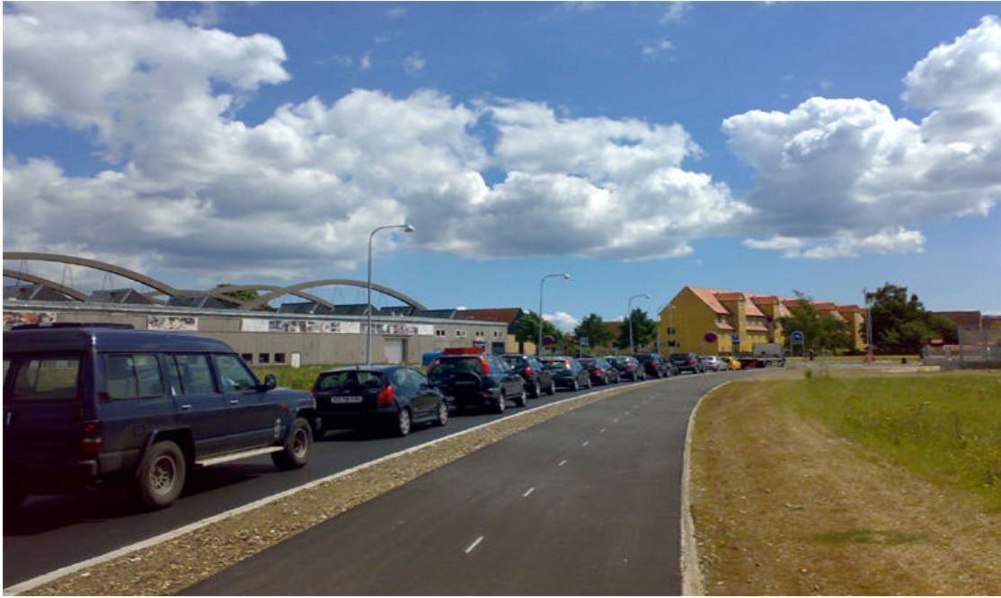
↑ Ventende bilkø på Bøjlevej, som skal til venstre ad Saltværksvej for at komme på Amager Strandvej.