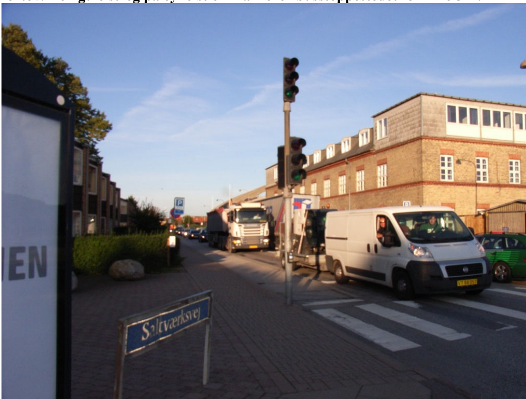
↑ Saltværksvej mod vest kl. 08.25 den 19. september 2008. Daglige køer, som pga. omkørsel ad Bøjlevej har tilføjet 2 ekstra højre- og 2 ekstra venstrestreng for al trafik i begge retninger.