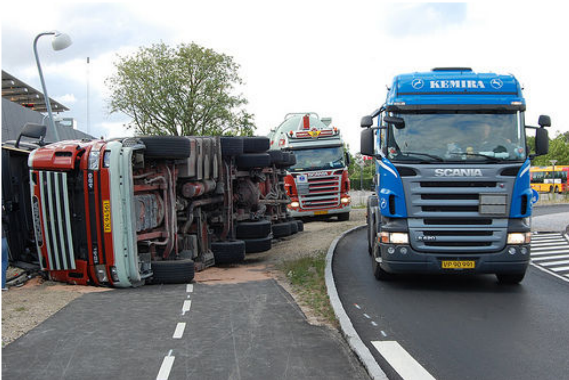
↑ Skarpt venstresving på Bøjlevej, hvor lastbil er væltet indover dobbeltrettet cykelsti.