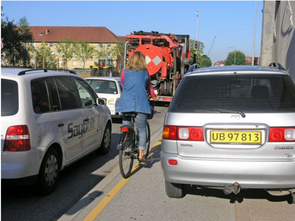
↑ Saltværksvej mod vest kl. 08.00 den 3. juli 2008. Parkeret bil på nordlig cykelsti samt fortov. Den gule streg på cykelstien markerer busstoppestedet for linie 5 A.