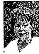
Ghita Nørby Kgl. skuespiller - Protektor for Hospice Forum Danmark

Hospice Forum Danmark Paraplyorganisation for hospicer og hospice-støtteforeninger i Danmark