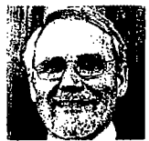
Formand for Den Danske Dyrlægeforening Per Thorup