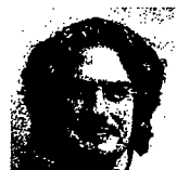
Sociolog, adjungeret professor ved Handelshøjskolen, København Henrik Dahl